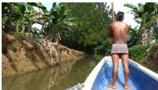
Déjeuner au sein de la communauté.

Départ pour une excursion dans le monde des indigènes. Navigation à bord d'une pirogue pour remonter la Rivière Chagres au cœur de la jungle. Observation de différentes sortes d'oiseaux (toucan, martin pêcheurs, vautour, etc.) et autres animaux au cours de la traversée. Rencontre avec la communauté Embera pour en savoir plus sur leur mode de vie. Marche dans la forêt pour savoir tout sur l'utilisation des plantes pour se nourrir, se guérir et s'habiller (accompagnés de votre guide francophone et d'un membre de la tribu). Présentation de leurs danses traditionnelles, de peintures corporelles réalisées avec le fruit tagua et de l'artisanat.